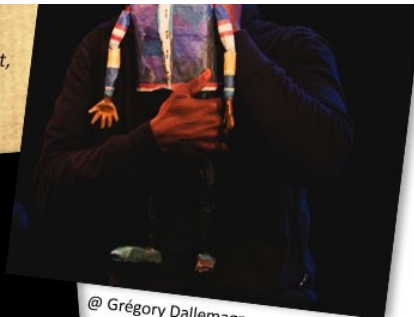
@ Grégory Dallemagne